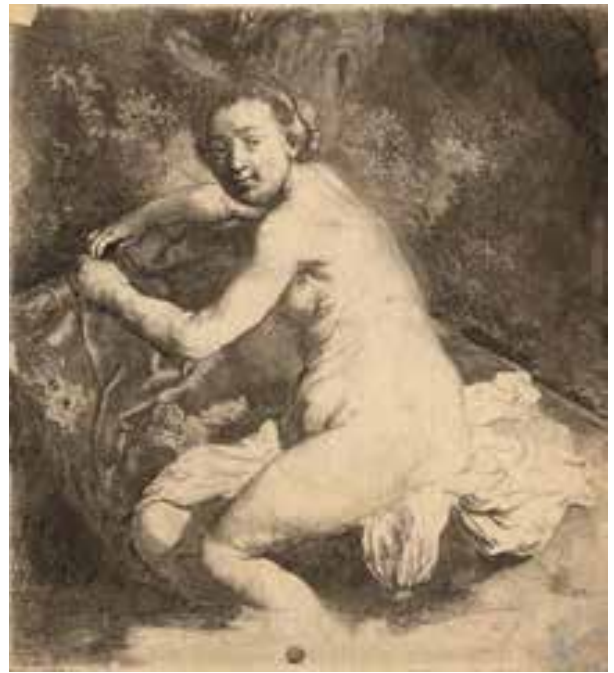
© Diane au bain , Rembrandt, BML