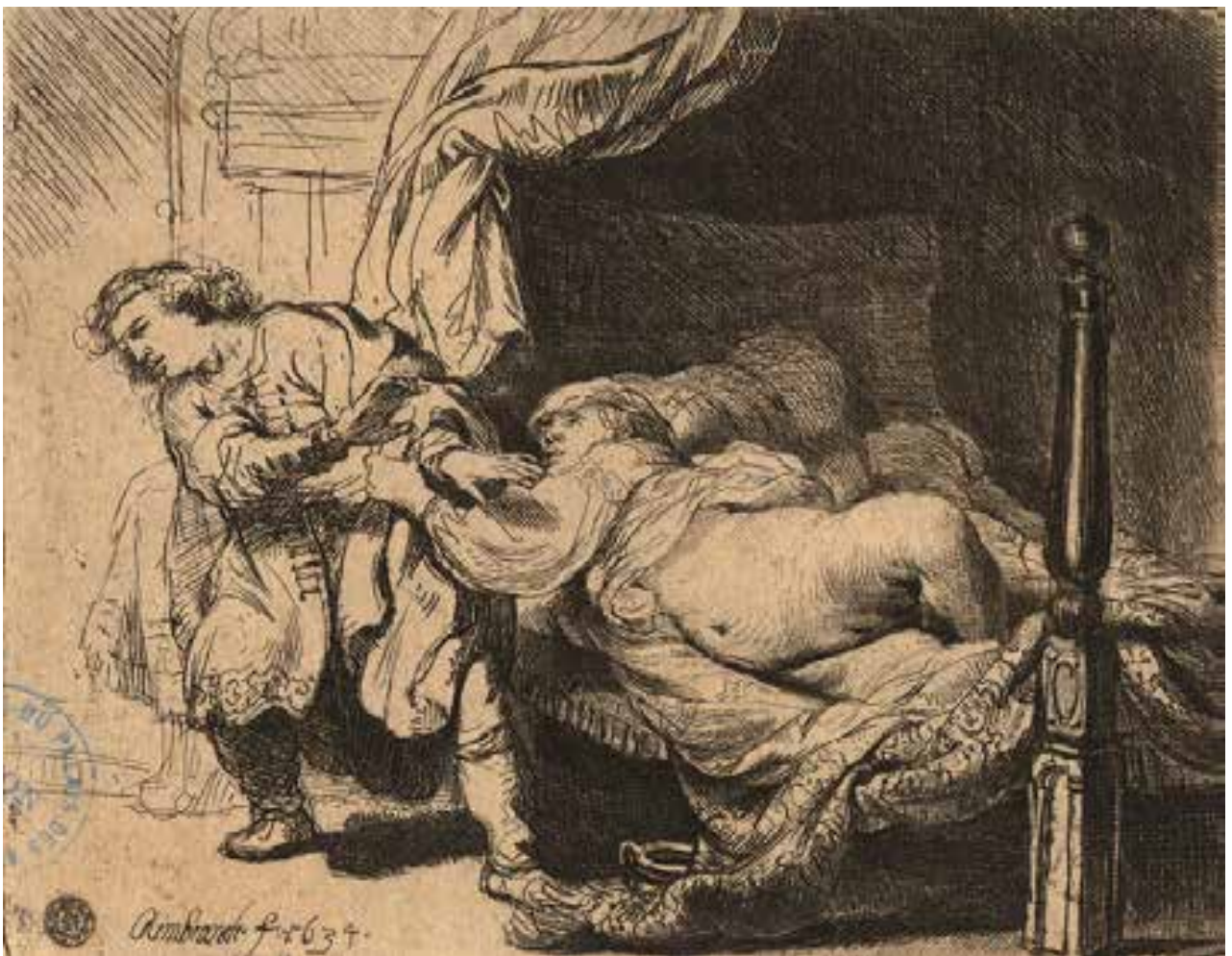
© Joseph et la femme de Putiphar , Rembrandt, BML