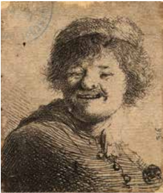
© Rembrandt riant , Rembrandt, BML